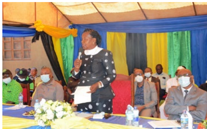
Naibu Waziri Wizara ya Ardhi, Nyumba na Maendeleo ya Makazi Dkt. Angeline Mabula akiongea na wananchi katika uzinduzi wa Baraza la Ardhi na Nyumba la Wilaya ya Mbarali mkoani Mbeya

Vyombo hivi vya utatuzi wa migogoro ya Ardhi vimekuwa na manufaa makubwa katika sekta ya ardhi ambapo jumla ya mashauri 203,495 yalifunguliwa tangu Mabaraza ya Ardhi na Nyumba ya Wilaya yalipoanzishwa Oktoba 2003 hadi 2021 na mashauri 176,118 sawa na asilimia 86.5 yamesikilizwa na kutolewa maamuzi.