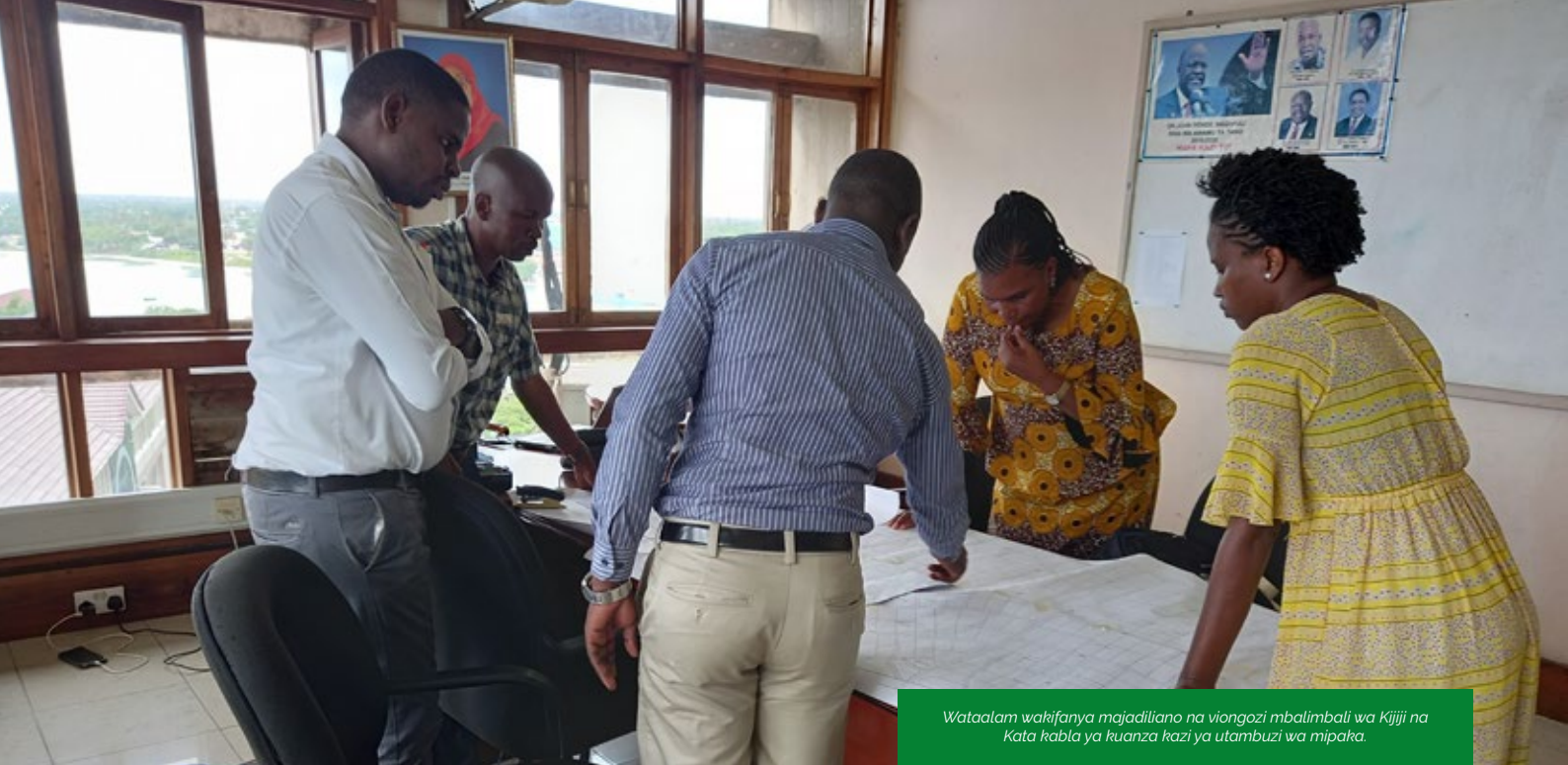
Wataalam wakifanya majadiliano na viongozi mbalimbali wa Kijiji na Kata kabla ya kuanza kazi ya utambuzi wa mipaka.