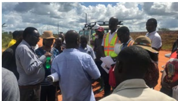
Wataalam wakiendelea na kazi ya utambuzi wa mipaka eneo la uwekezaji.

Ardhi ni rasilimali kuu katika jamii na matumizi yake ni mtambuka hivyo maendeleo katika sekta mbalimbali nchini yanategemea ardhi ndiyo maana Wizara inashirikiana na wadau mbalimbali wa maendeleo katika ujenzi wa Taifa. Kwa kutambua mchango wa Sekta ya ardhi katika nyanja mbalimbali, Wizara inaendelea kutambua, kupanga, kupima na kumilikisha ardhi hatua ambayo inakusudiwa kuwa suluhisho la kupunguza migogoro ya matumizi ya ardhi pamoja na kutambua, kuhakiki uwekezaji katika ardhi ili kutambua mchango wake katika uchumi wa Tanzania.