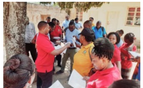
Maofisa kutoka Wizara ya Ardhi, Nyumba na Maendeleo ya Makazi Makuu Dodoma wakipeana maagizo namna ya kutekeleza zoezi la elimu ya mlipa kodi nje ya Ofisi ya Halmashauri ya Manyoni, kabla ya kuanza utekelezaji wa zoezi hilo nyumba kwa nyumba katika mtaa wa Majengo.

Moja ya mikakati ya Wizara kukabiliana na changamoto hiyo ni kuendelea kutoa elimu na uhamasishaji wa kulipa kodi ya pango la ardhi kupitia matangazo kwenye vyombo vya habari (runinga, radio, magazeti na mitandao ya kijamii) lakini pia kuongeza kasi ya kupanga, kupima na kumilikisha kila kipande cha ardhi ili kuongeza idadi ya viwanja na kupata wigo mpana wa makusanyo.