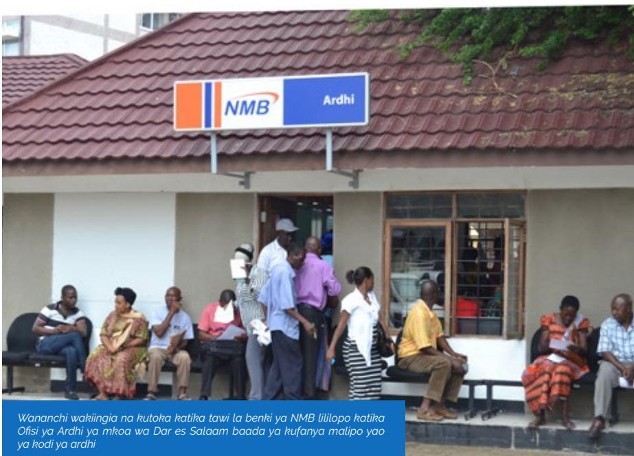
Wananchi wakiingia na kutoka katika tawi la benki ya NMB lililopo katika Ofisi ya Ardhi ya mkoa wa Dar es Salaam baada ya kufanya malipo yao ya kodi ya ardhi